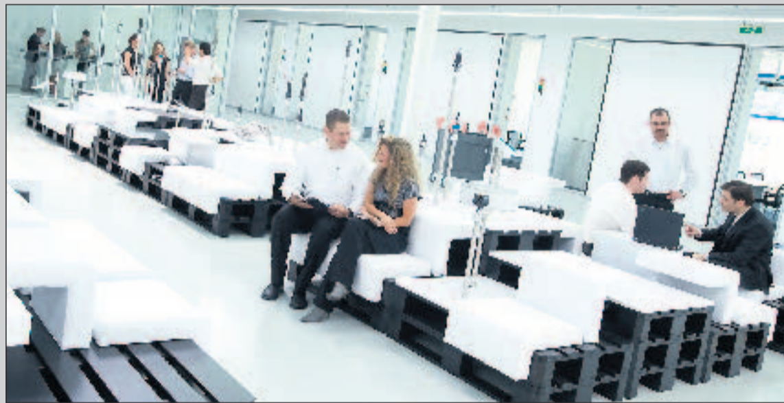
Kreative Tüftler sollen hier neue Ideen entwickeln.