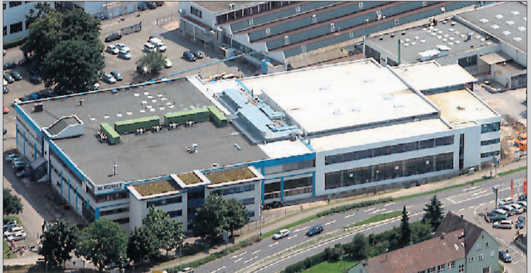
Direkt an die Fertigungshalle angebaut wurde das neue Entwicklungs- und Schulungszentrum.