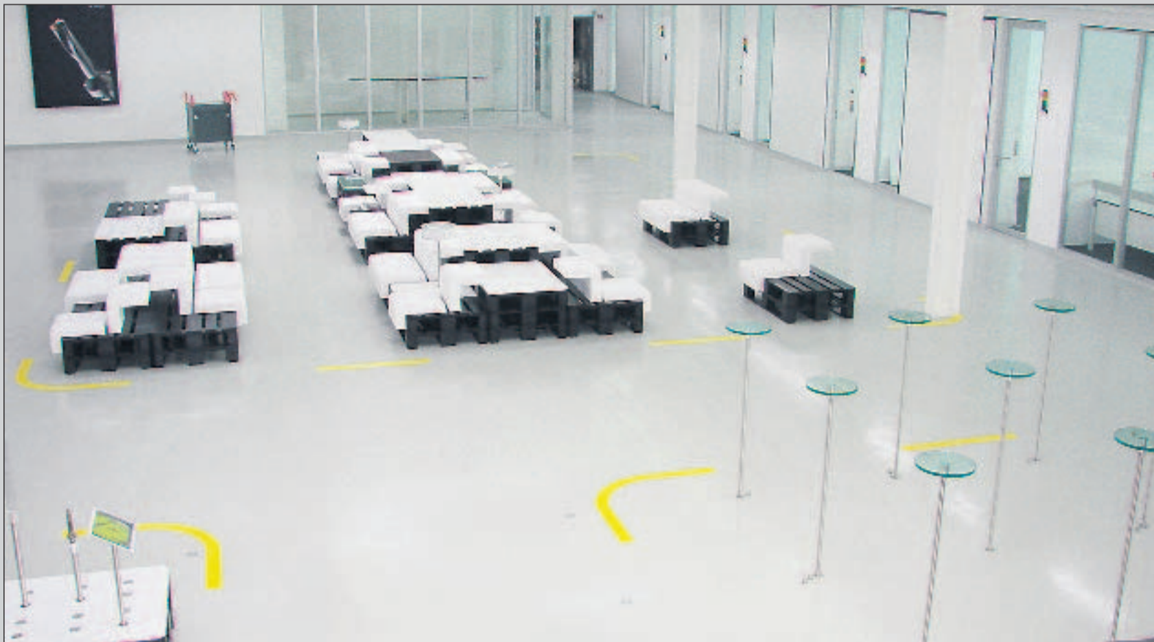
Das Industrie-Ambiente in der „Ideen-Fabrik +“ soll auch Wohlfühlatmosphäre ausstrahlen.

Diese räumliche Nähe trägt dazu bei, dass sich Denken und Kreativität nicht abgehoben-zwecklos, sondern besonders praxis- und wirklichkeitsnah gestalten. Insgesamt verwischen dabei die Grenzen zwischen „Fertigung“ und „Kreativität“ auch optisch, weil für die Innenausstattung der „Ideen-Fabrik +“ ein speziell designtes Industrieambiente gewählt wurde, das dennoch eine Wohlfühlatmosphäre ausstrahlt.