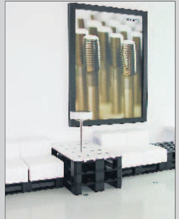
Auch für Ruhepausen ist Platz vorgesehen.

Dazu gibt es ein umfangreiches Schulungsprogramm. Alle Mitarbeiter kommen beispielsweise in den Genuss unterschied-