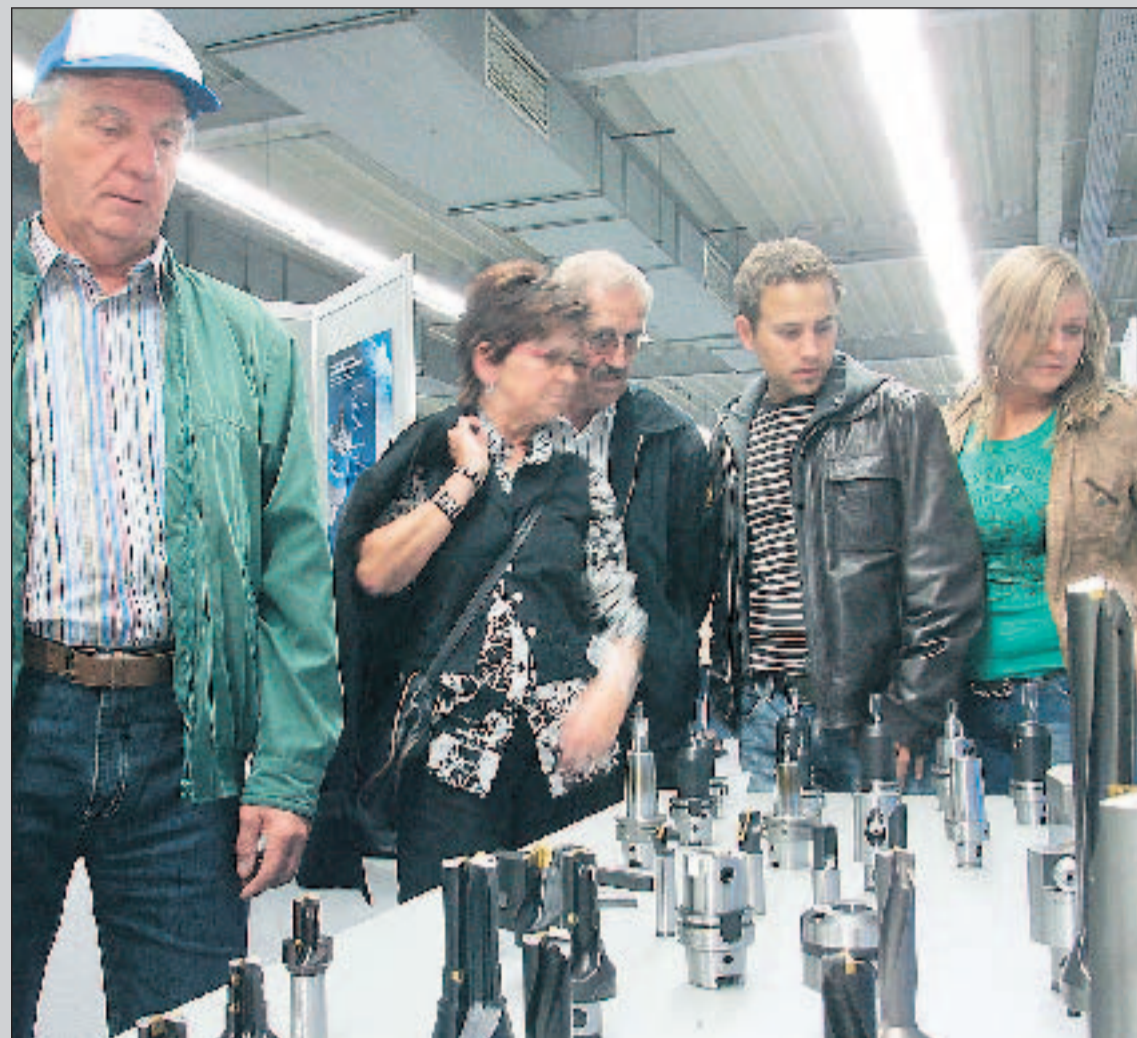
Wie Bohrwerkzeuge hergestellt werden, erläutern Komet-Mitarbeiter beim Familientag.

Erreicht wurde dies durch eine konsequente Innovationspolitik. Am Ziel sieht sich die Unternehmensführung aber trotzdem noch nicht: „Gerade im Jubiläumsjahr ist dies mehr denn je unsere Motivation, für unsere Kunden mehr zu sein als nur Hersteller und Anbieter von Premiumprodukten“, heißt es. Spitzenleistungen in Technologie, Prozessbeherrschung, Mitarbeiterqualifikation und Kundenorientierung werden angestrebt.